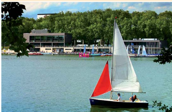
Blick über Münsters Aasee, im Hintergrund das Restaurant A 2